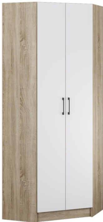
Схема сборки изделия Прихожая «Денвер» Шкаф угловой 2150*800/800*380