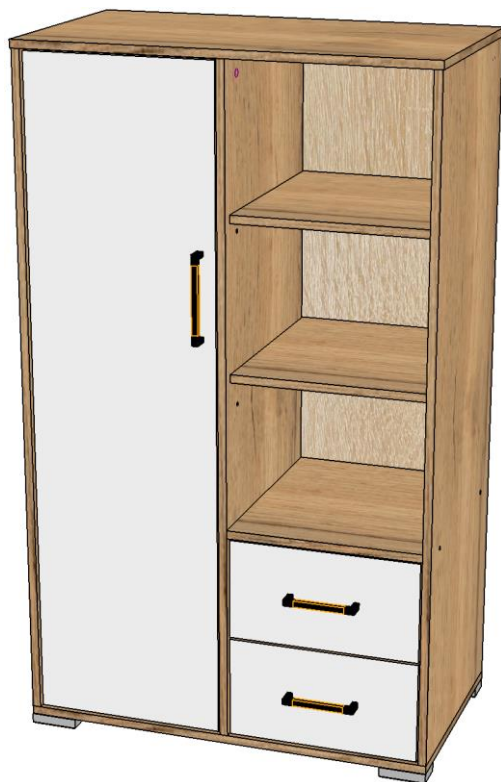
Схема сборки изделия Спальня «Бланка» Стеллаж книжный малый (фасад) 1350*800*450